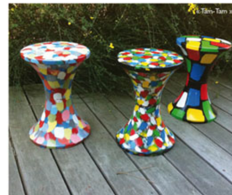
« Tim-Tam »