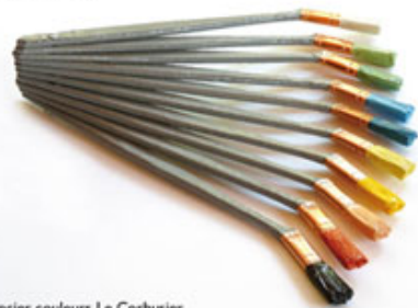
Nuancier couleurs Le Corbusier