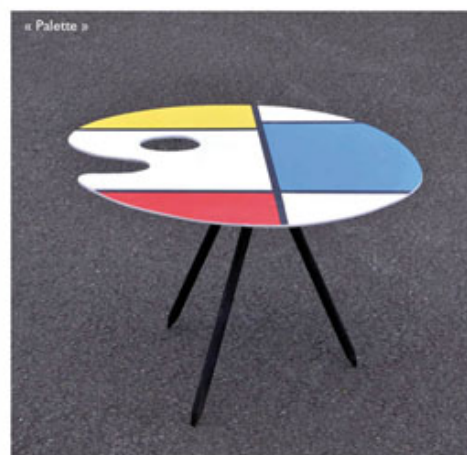
« Palette »