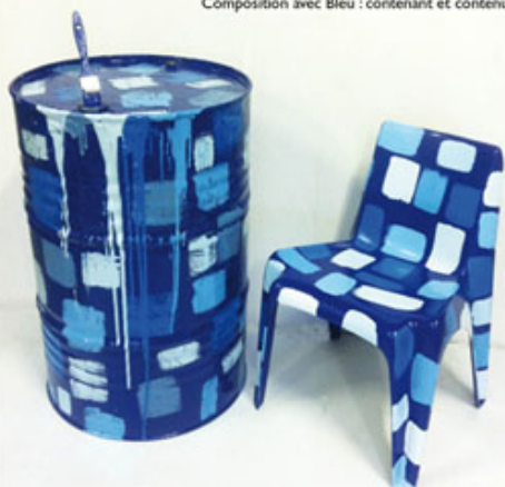
Composition avec Bleu : contenant et contenu

« Le pinceau est fait pour peindre, moi je le peins, je lui applique la fonction première pour laquelle il a été fabriqué. Mon pinceau est vivant, il sort du tiroir où il reposait pour venir se coller sur une toile ou une construction. »