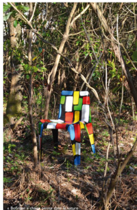
« Boomer » chaise peinte dans la nature