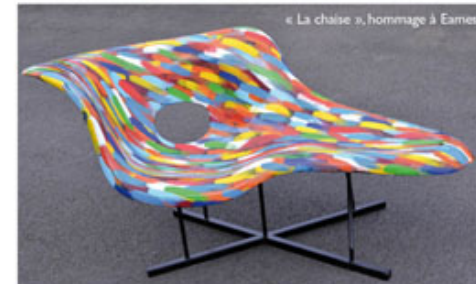
« La chaise », hommage à Eames